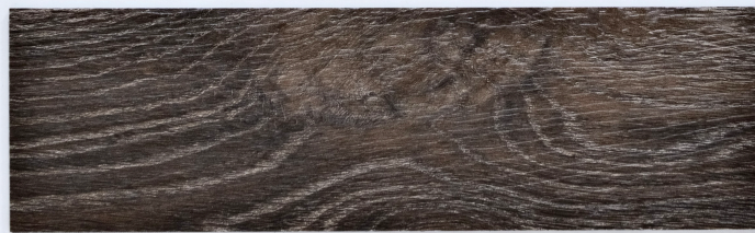
木 Y2307 / 阿爾特冷橡 Aalter ◆ 特殊花色 184mm x 1219mm 厚度 2.0mm 耐磨層 0.3mm UV Coating