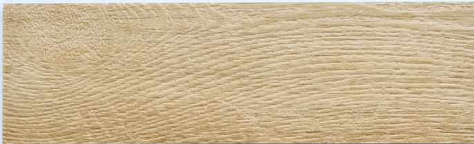
木 Y2302 / 恩佐勒黃橡 Ndjole

184mm x 1219mm 厚度 2.0mm 耐磨層 0.3mm UV Coating