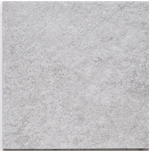
石 Y2334 / 奧雷瑟冷岩 Olathe 457mm x 609mm