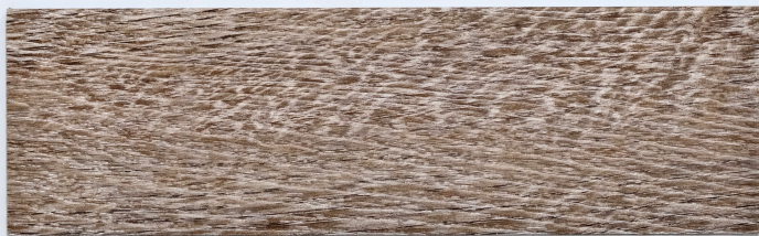
木 Y2306 / 開西克橡木 Keswick 184mm x 1219mm 厚度 2.0mm 耐磨層 0.3mm UV Coating