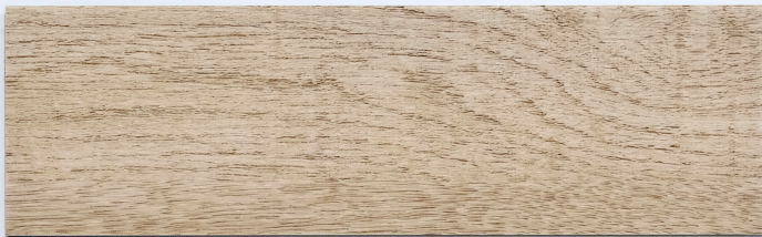
木 Y2301 / 莫利納米橡 Molina ◆ 特殊花色 184mm x 1219mm 厚度 2.0mm 耐磨層 0.3mm UV Coating