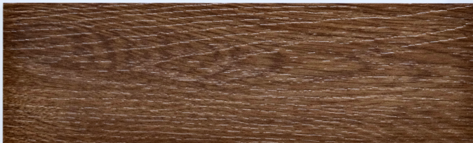
木 Y2304 / 克林森橡木 Clemson

184mm x 1219mm 厚度 2.0mm 耐磨層 0.3mm UV Coating