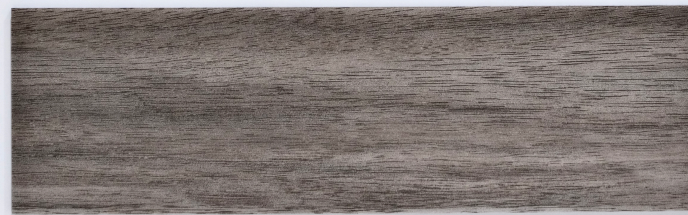
木 Y2312 / 奧利安灰橡 Olean