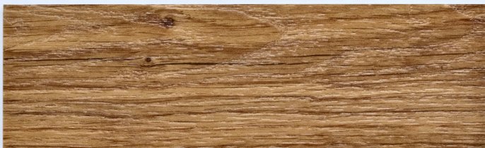
木 Y2303 / 安戈樹棕橡 Andoche

184mm x 1219mm 厚度 2.0mm 耐磨層 0.3mm UV Coating