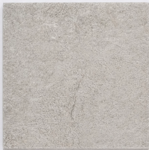
石 Y2332 / 秀克斯灰岩 Chaux 457mm x 609mm