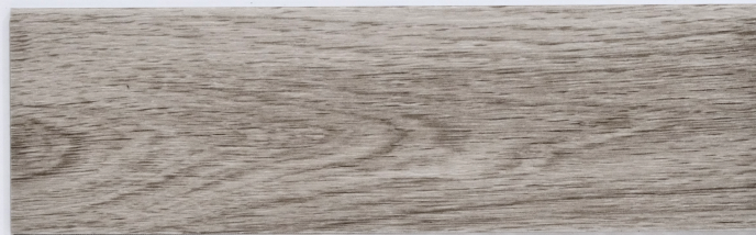
木 Y2310 / 丹德利灰橡 Dandeli ✦ 特殊花色