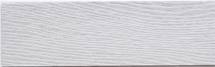
木 Y2308 / 安堤伯白橡 Antibes