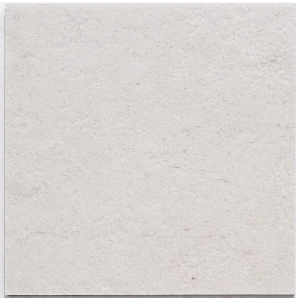
石 Y2331 / 蒙波斯淺礫 Mompos 457mm x 609mm