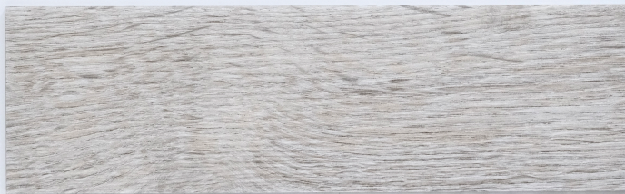
木 Y2309 / 開瑟里灰橡 Kayseri 184mm x 1219mm 厚度 2.0mm 耐磨層 0.3mm UV Coating