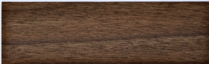
木 Y2305 / 伊斯美深橡 Ismail

184mm x 1219mm 厚度 2.0mm 耐磨層 0.3mm UV Coating