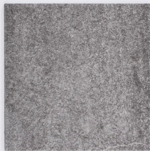
石 Y2333 / 普立吉灰岩 Prizzi 457mm x 609mm