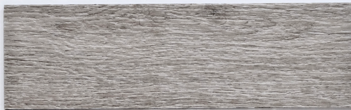
木 Y2311 / 曼巴沙橡木 Mambasa